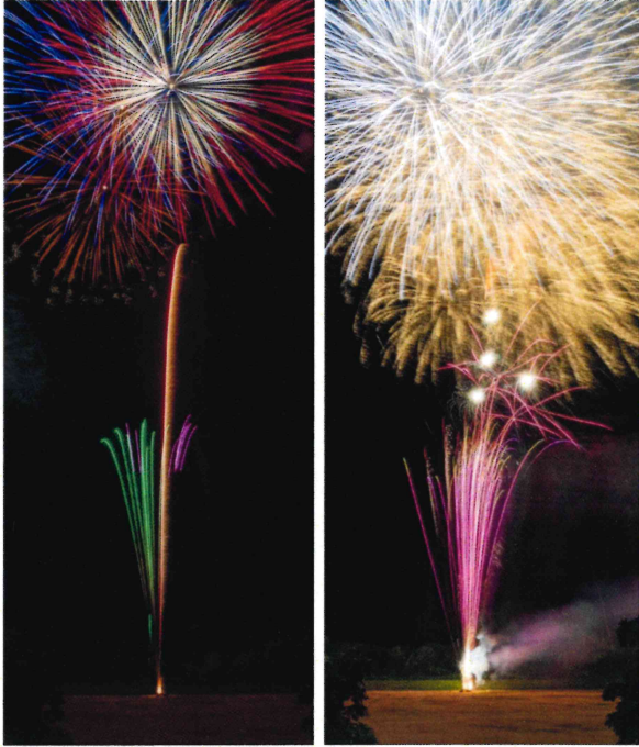
花火画像提供：鈴木 亮氏