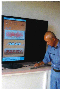
アプリを使って抽選中

この大会の運営費は、各戸からの協力が資金源であることから、「地域還元」をキーワードに、抽選会の対象を全戸としました。来場できない方も花火とともに夏まつりを楽しんでいただきたいという思いもあります。 今年、主に致芳地区内各店舗の逸品47本をラインナップし、一等賞は、昨今の物価高騰に伴う生活応援の観点でガソリン券3万円を用意しました。9月1日に抽選券を全戸に配布し、15日に当選発表を行い、当館窓口にて贈呈致しました。なお、残念ながら引き換えにならなかった賞品は、文化祭の会場にて再抽選させていただきます。