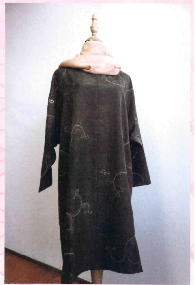
くるみの葉の“絞り染め”