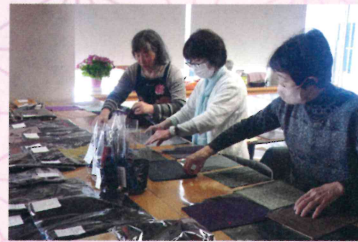
販売コーナーも充実♪