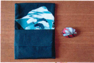
ワークショップもお気軽に♪