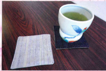
来場者には「長井紬コースター」進呈!