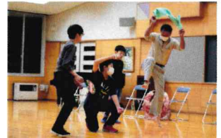
お師匠様から技と心を伝授