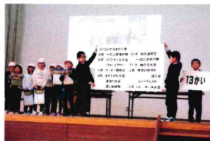
学習の成果を発表