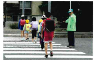
安全安心な登下校