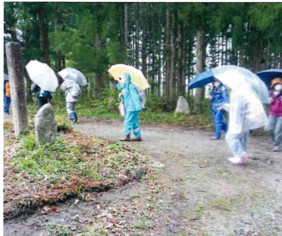
「六道の辻」から西高玉へ