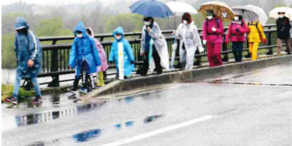
睦橋を渡って川東へ

4月29日(木)、第61回目となる「一日八里～春の陣～」を開催しました。あいにくの雨でしたが、地区内外、小学2年生から70代と幅広い年齢層の方々、39名が参加しました。今回のコースは、致芳ふるさとめぐりコースと題し、致芳の史跡をめぐるコースを設定しました。コミュニティセンターを出発し、白兔葉山神社↓西高玉公民館↓浅立↓東五十川↓森を通って約29キロを完歩しました。今回の見所は、白兔の六道の辻から西高玉へ抜ける道や東五十川から森へ抜ける林道を設定しました。参加者は、かつて先人たちが生活道路として活用していた林道を歩きながら、歴史に思いを馳せました。今回もゴール後の温泉入浴と慰労会を自粛しての開催となりました。次回の秋の陣は、10月16日(土)に行います。ぜひご参加ください。