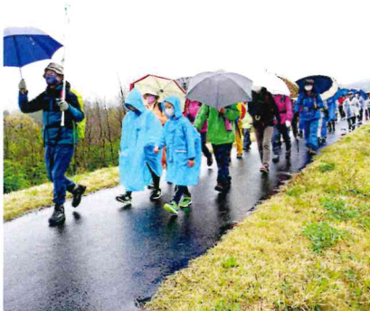
さくらづつみを通過