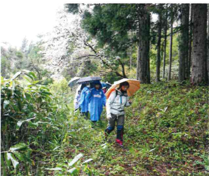
先人が歩いた東五十川～森の林道