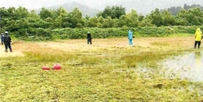
たくさんの方にご協力いただきました

6月24日(木)致芳河川敷地スポーツ公園運営委員会役員と、成田、西五十川、白兔の各地区青年会代表の皆様にご協力いただき、河川敷グラウンドの草刈りを行いました。直前まで雨模様だったこともあり、大変足元が悪い状態での作業となりましたが、駐車場やグラウンドの周りがすっきりしました。次回は「致芳橋」架橋促進夏まつり大会が行われる8月21日(土)に実施します。ご協力よろしくお願い致します。