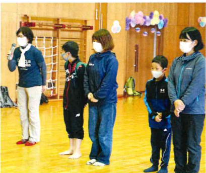
恒例！新人さん紹介♪