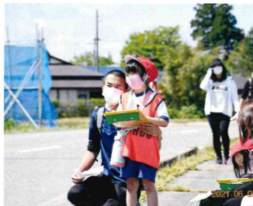
親子で協力し合いながら♪