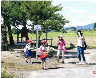
お母さんも大奮闘!

6月5日(土) 西五十川一帯を会場に「かんぼ知る区ロード探検ウォークラリー大会」を開催致しました。この事業は、致芳の名所旧跡などを巡りながらクイズやゲームに挑戦し、致芳の魅力を見つけることを目的に毎年開催しています。 今年も致芳小学校1学年部会の親子行事とタイアップしての開催となりました。また、1年生以外の子ども達もチームを組んで参加し、13チーム71名で競い合いました。 今年、「体力消耗コース」として設定した5キロのコースを、約2時間かけて完歩しました。コース沿いには、22カ所のチェックポイントを設け、親子で協力し励まし合いながらの道程でした。 今年、スマートフォンを活用したクイズも出題しました。袋稲荷神社と八反田地蔵尊では、QRコードを読み取り、コミセンのホームページにアクセスし問題を解きました。