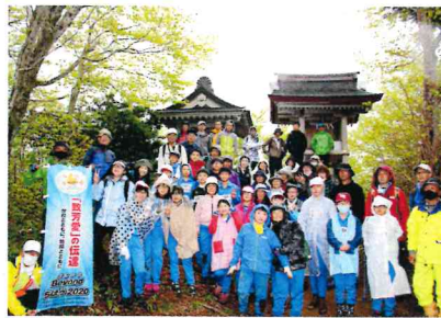
登頂成功! みんな笑顔!