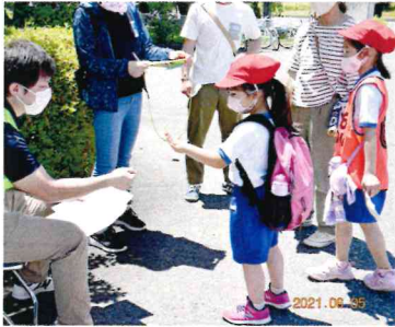
じゃんけんでボーナスポイント!