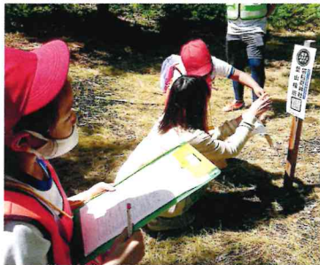
QRコードを読み込んで!